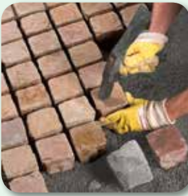
Pflaster hammerfest setzen