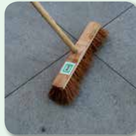
... und feuchtem Besen abreinigen