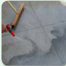
mit Wassersprühstrahl ...