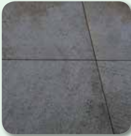
Fläche rückstandsfrei reinigen