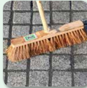
... und feuchtem Besen abreinigen