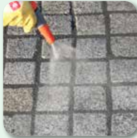
mit Wassersprühstrahl ...