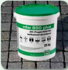
Fläche rückstandsfrei reinigen