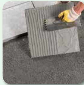
bei Platten unterseitig HaftBrücke auftragen