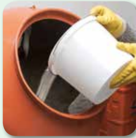
max. 2 l Wasser vorlegen