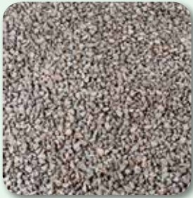
Unterbau und Tragschichten vorbereiten