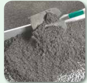
Mörtel aufbringen und über Lehren abziehen