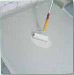
... und mit Fellrolle verteilen