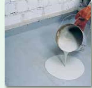
Bindemittel aufbringen ...