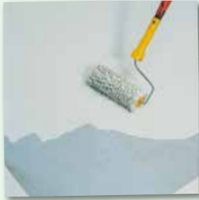
Die 2. Applikation frühestens nach ca. 12 Stunden auftragen