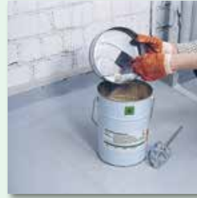
Komponente B in Komponente A einfüllen und gründlich durchmischen