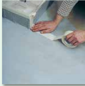
Zu beschichtende Fläche abkleben